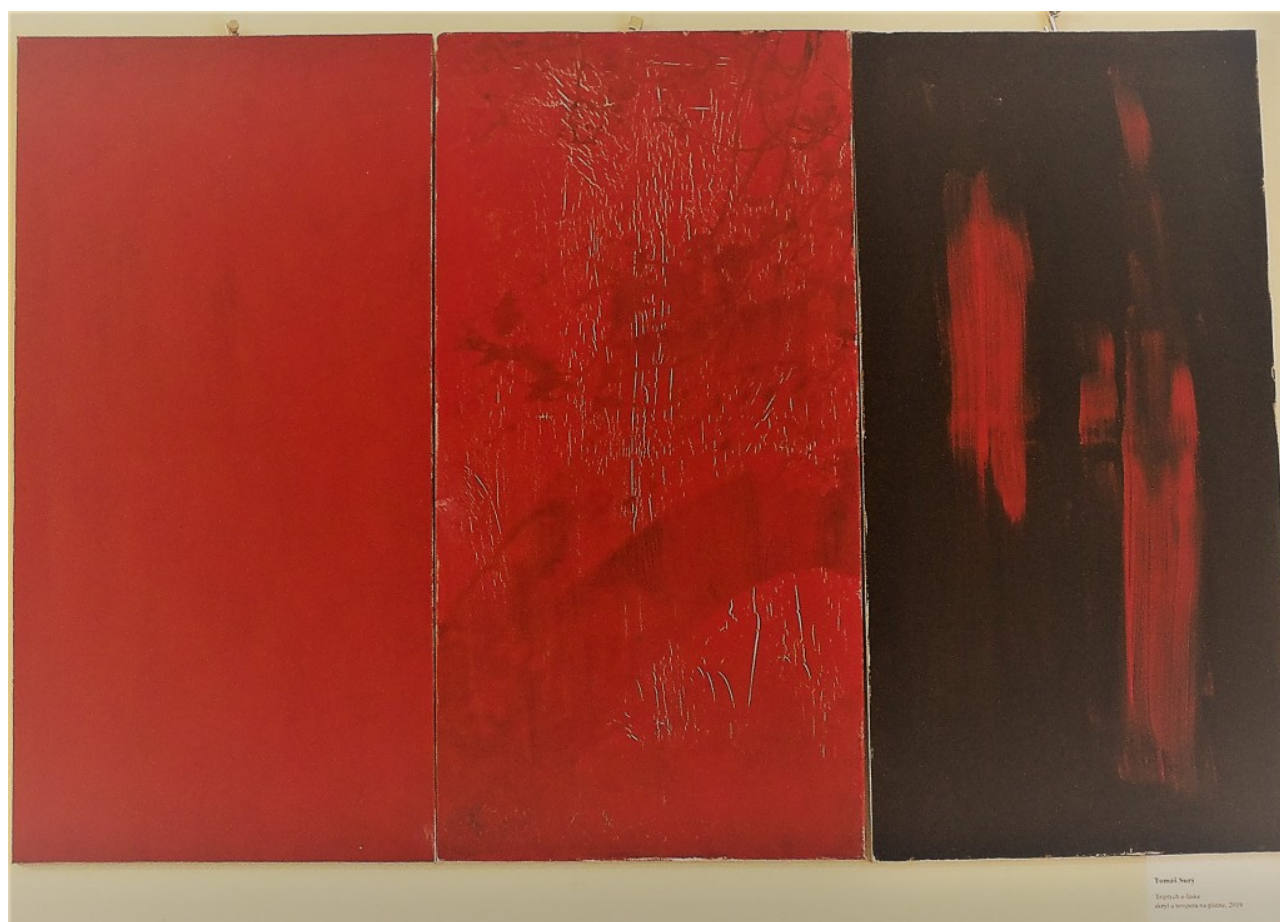
(9) © Tomáš Surý: „Triptych o láske“ (akryl a tempera na plátnach), 2019