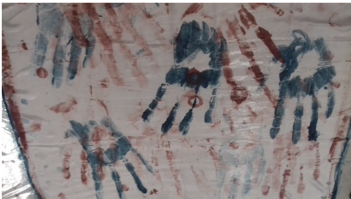
(5) © Tomáš Surý: „Pocta Vladimírovi Boudníkovi“ (expresívne exponionistický prejav na hodvábe), 2018