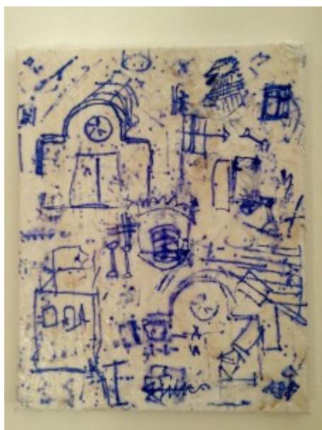
(3) © Tomáš Surý: „Skice z Dalmácie - august 2014“ (kombinovaná technika na plátne), 2014