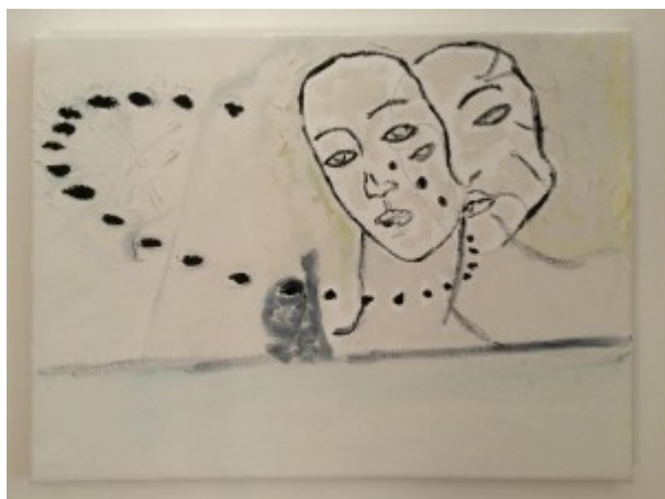
(2) © Tomáš Surý: „Slimák zanechávajúci na bielych kvetoch čierne slizové stopy je vo vytržení z vízie Botticelliho Venuše odhaľujúcej svoju pravú tvár“ (tempera na plátne), 2014