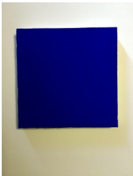
(4) © Tomáš Surý: „Detail Fra Angelicovej Madony“ (akryl na plátne), 2014