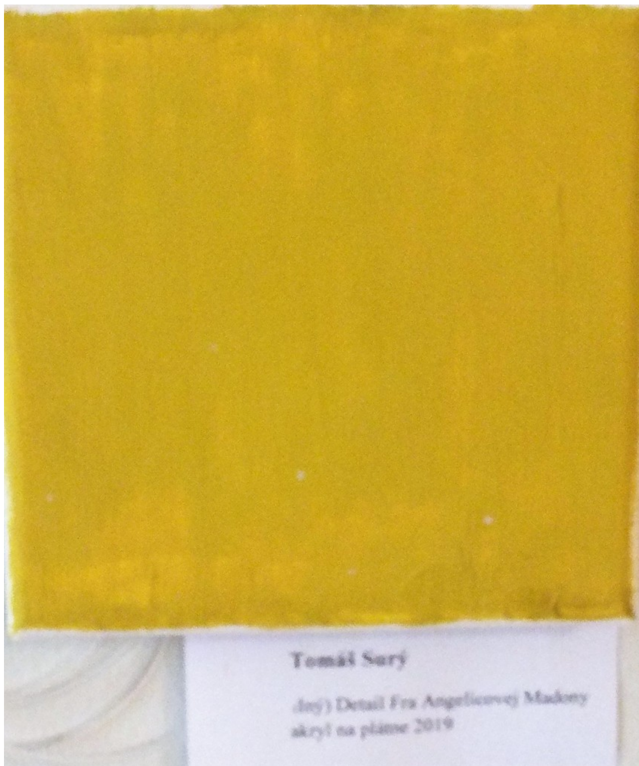
(6) © Tomáš Surý: „Iný detail Fra Angelicovej Madony“ (akryl na plátne), 2019