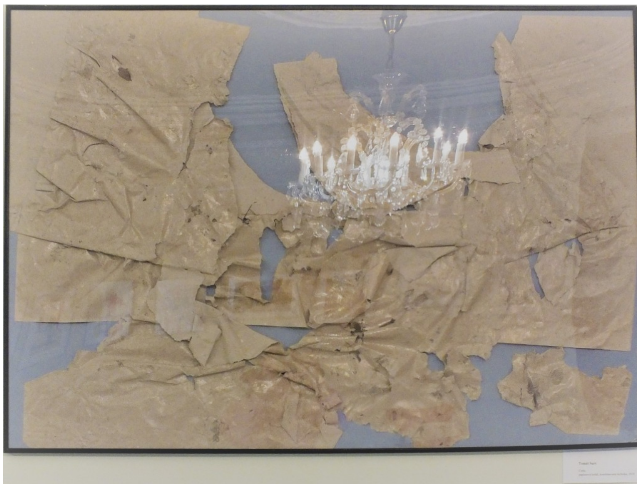
(8) © Tomáš Surý: „Cesta“ (kombinovaná technika, asambláž), 2019