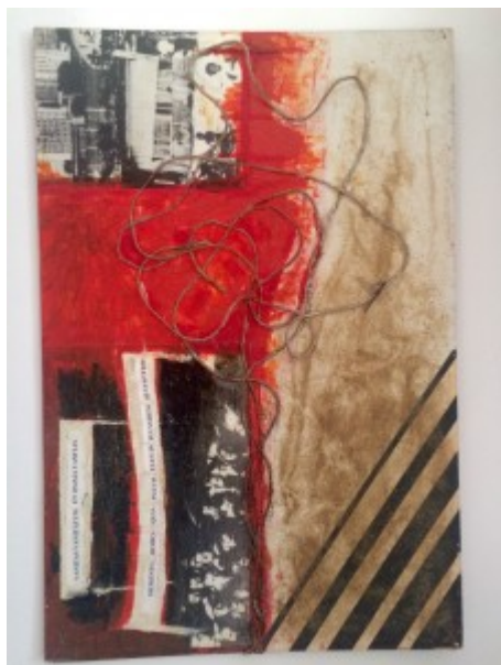
(1) © Tomáš Surý: „Vanitas vanitatum“ (kombinovaná technika na preglejke), 1997