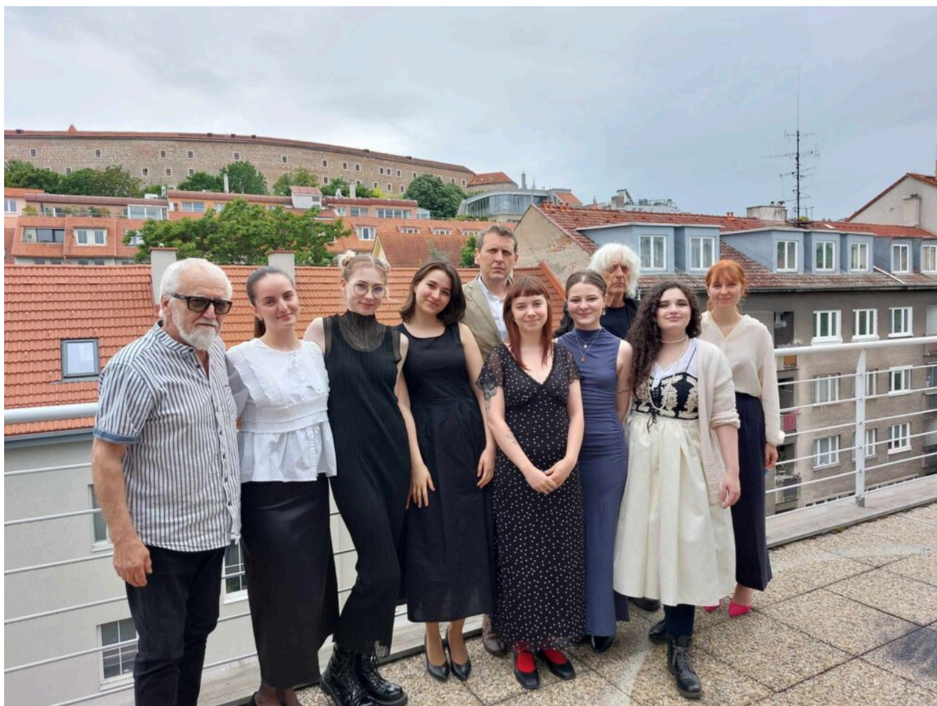
Absolventi 2025 („veľké“ scénografky)