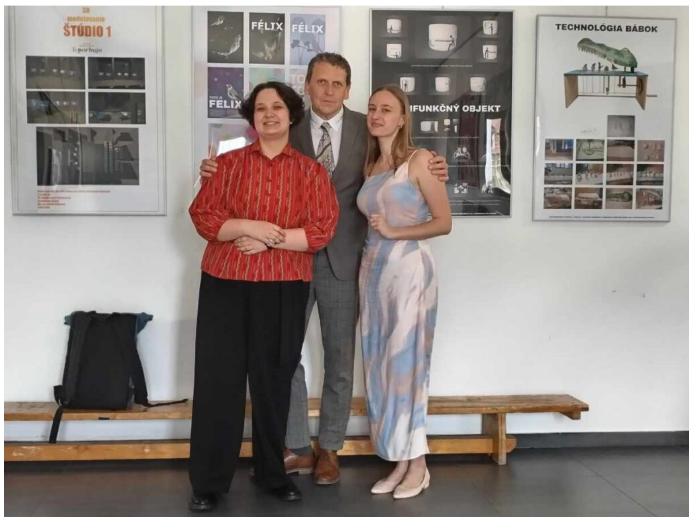
Absolventi 2025 (bábkarske scénoğrafky)