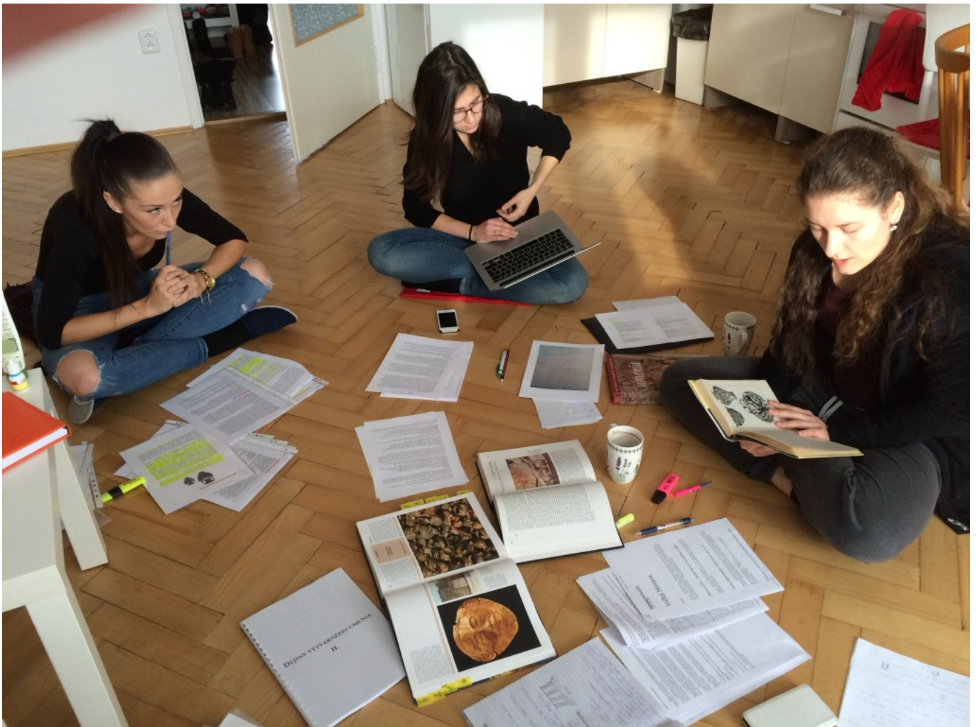
Baletky v akcii = vzor prípravy na prvú skúšku...