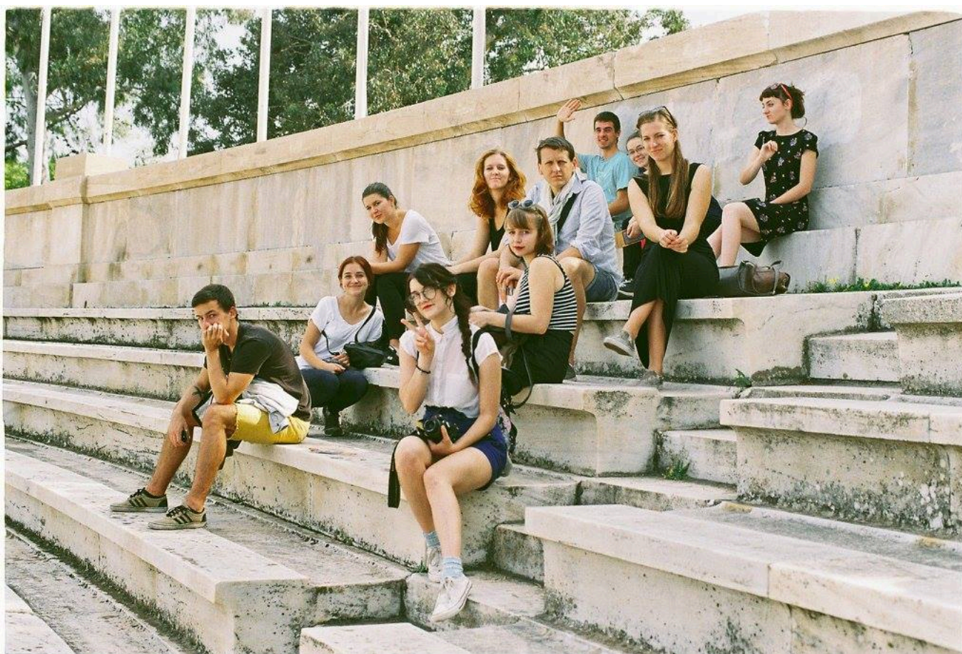
Scénografi v Aténach (2015)