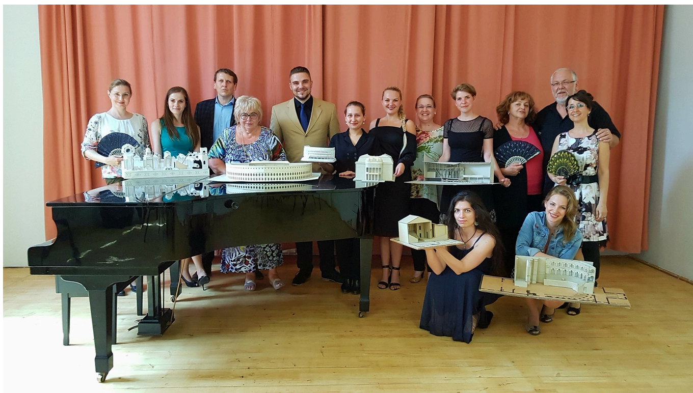
Učítelia a študenti KS na štátniciach v roku 2017