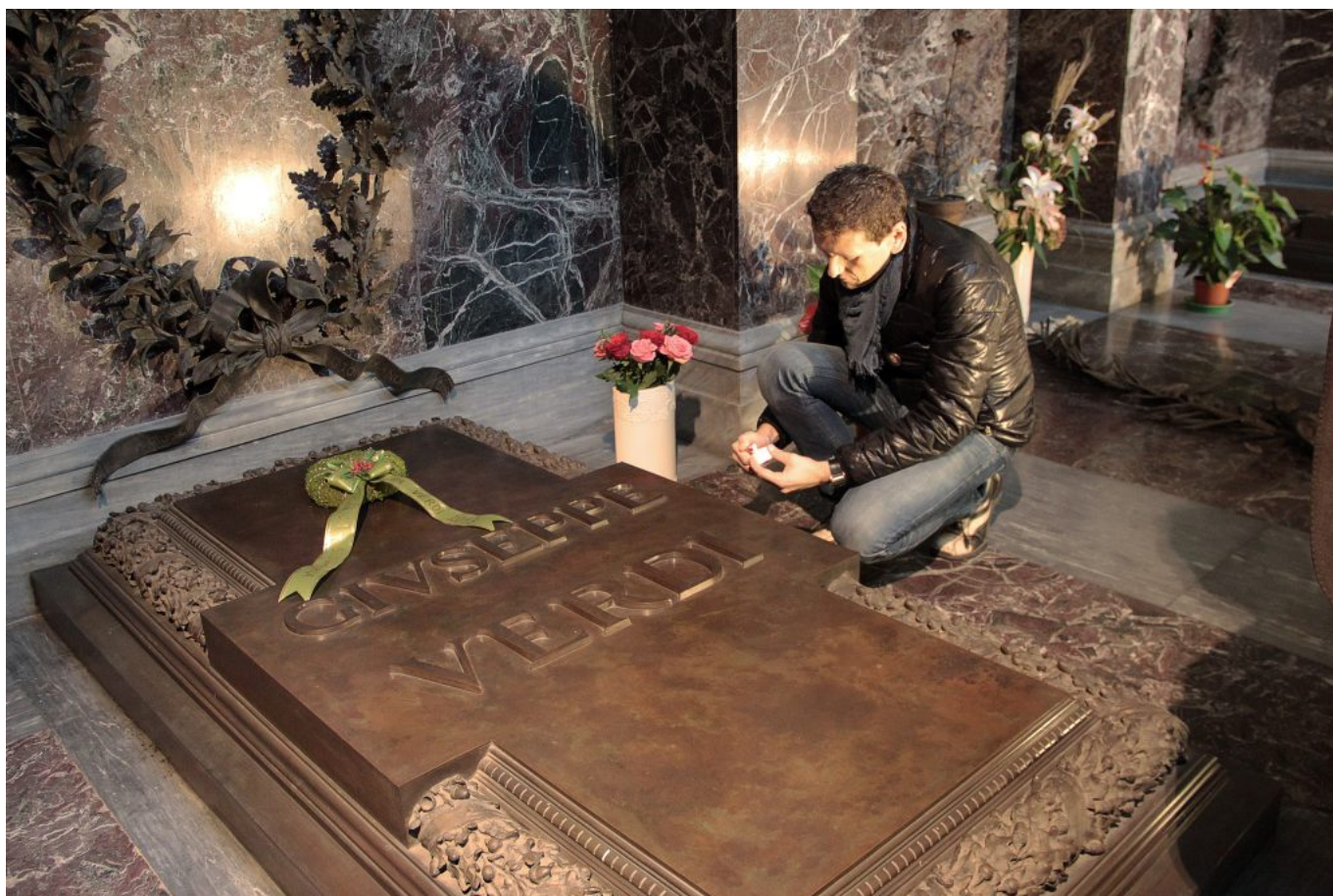
Milano, Casa Riposo, 2013